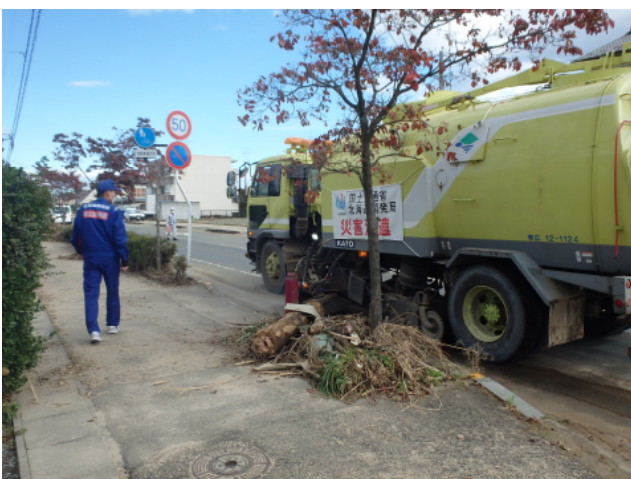
応急対策班（路面清掃等）