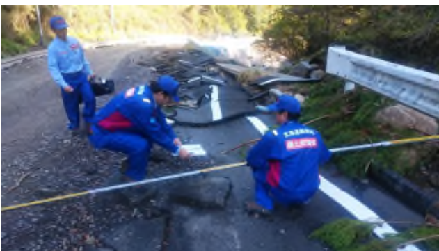
被災状況調査班（道路）