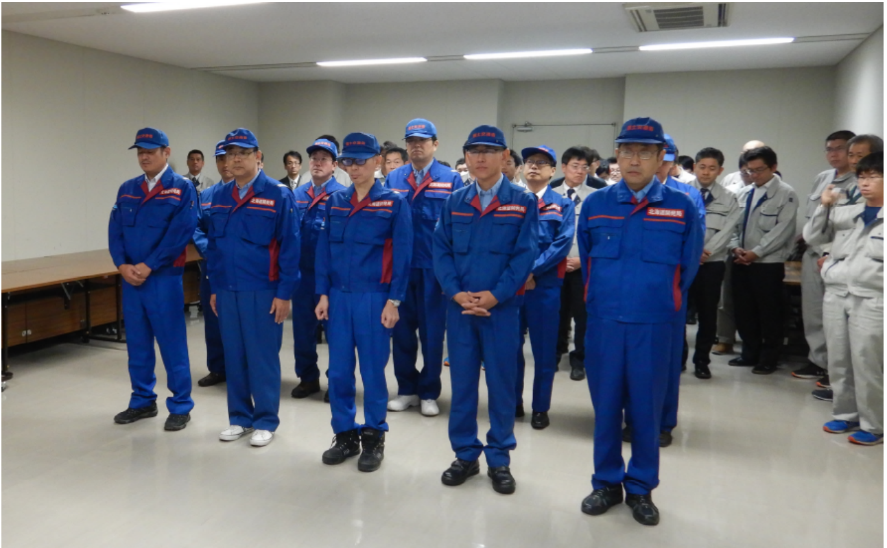
出発式 派遣される被災状況調査班（河川）及び被災状況調査班（道路・釧路2班目）