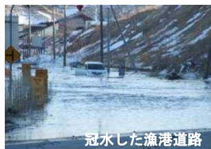
冠水した漁港道路