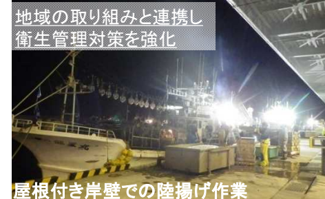
屋根付き岸壁での陸揚げ作業