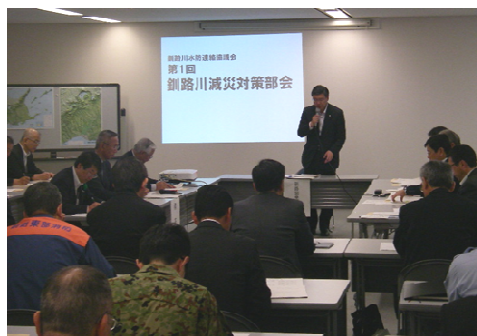
第1回釧路川減災対策部会の様子