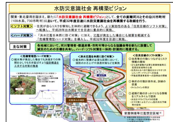
水防災意識社会 再構築ビジョン(国土交通省)