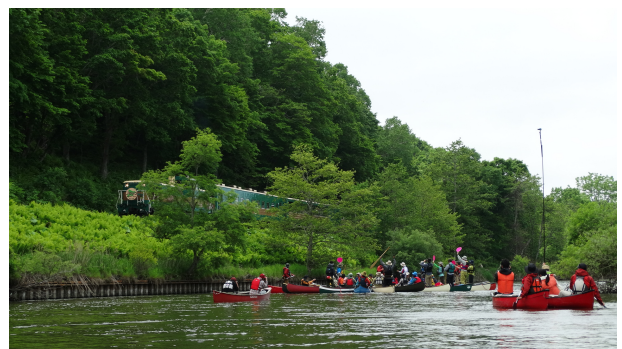
カヌーの花を作りノロッコ号歓迎