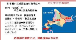
明治政府の 取組概要