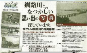
釧路川治水100年 記念事業の紹介