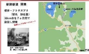
釧路鉄道開業 までの歴史

北海道標茶高等学校 地域環境系列所属の生徒より、ロシア南下政策に備えた明治政府による北海道開拓期の取組や、釧路川とともに発展してきた道東の歴史について研究されてきたこと発表していただきました。