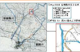
大正9年大洪水と 新釧路川建設