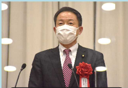
長谷川岳参議院議員