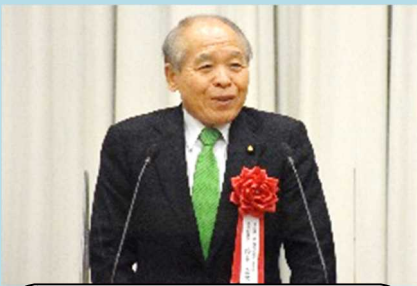
鈴木宗男参議院議員