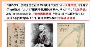
釧路開拓期の 動きと人物