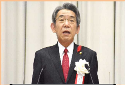
蝦名大也釧路市長