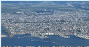
釧路川流域の概要