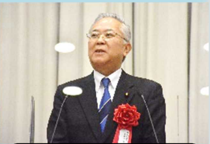
横山信一参議院議員