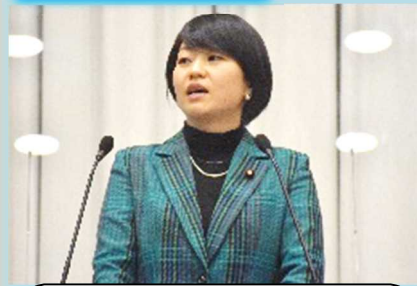
鈴木貴子衆議院議員