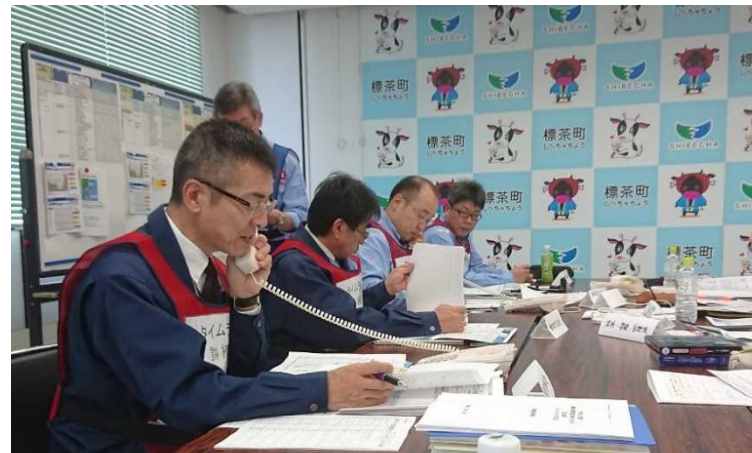
災害対策本部における訓練の様子 (訓練コントローラー側) 標茶町・地方気象台・河川事務所