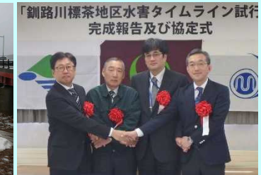
タイムライン試行版の完成 (平成30年10月)