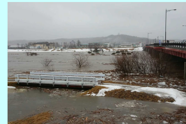
融雪期に発生した釧路川の出水 (平成30年3月)