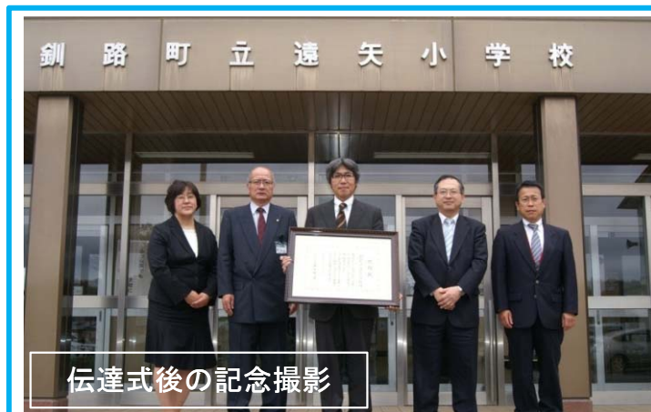
伝達式後の記念撮影