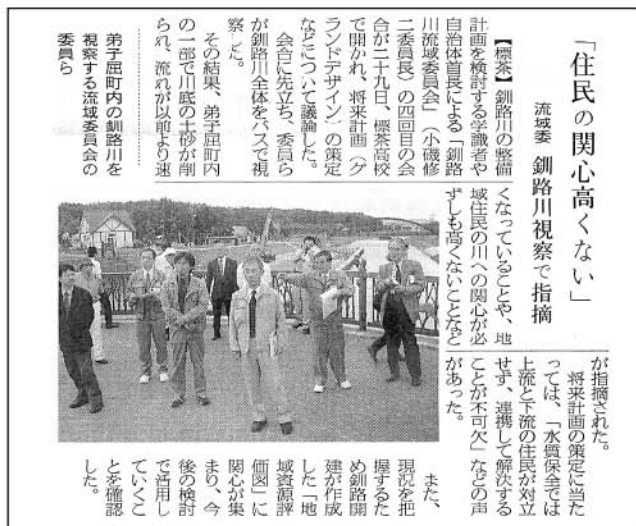
▲平成15年7月30日 北海道新聞