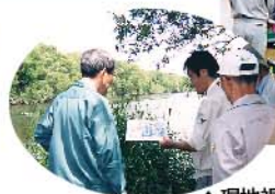
▲現地視察の様子(幣舞橋周辺)

委員会では、釧路川流域の整備方針(ランドデザイン)についての議論や、第2回釧路川下流域部会の報告等がなされました。