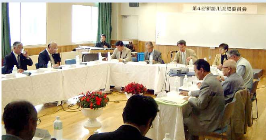
▲第4回釧路川流域委員会の様子

北海道開発局及び北海道では、今後概ね20～30年間の具体的な河川整備の内容を示す「釧路川水系河川整備計画」を策定します。このため、地域住民、学識経験者等から意見をいただくことを目的として「釧路川流域委員会」を設置しました。