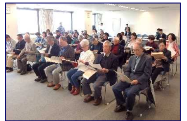
活動内容の説明を聞く参加者の皆様

その後、事務局より活動内容の説明があり、参加した皆さんは真剣に聞き入り、釧路湿原の環境保全の取り組みが始まりました。