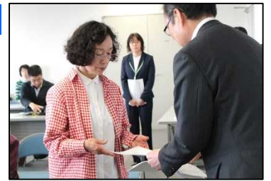
認定証が渡されました

平成30年度の「釧路湿原川レンジャー」は、新規登録者8名が加わり計117名の釧路湿原周辺に住む幅広い年代の方々が登録しました。その中の9名は、平成12年の発足から19年連続で登録されています。