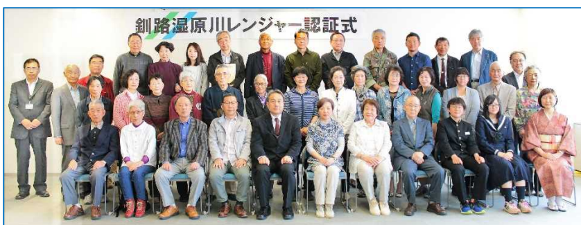
認証式に出席した「釧路湿原川レンジャー」の皆様