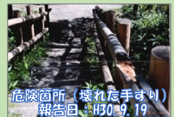
危険箇所（壊れた手すり） 報告日：H30.9.19