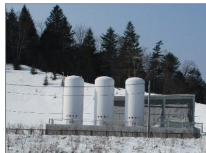
水素実証実験施設

◆ 展示室ではダムができるまでの流れなどについてのパネルを見学しました。また、ダムを監視するための「監査廊」を歩いてダム内部を見学しました。