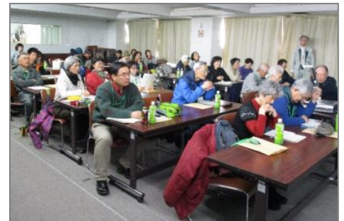
説明に聞き入る皆さん