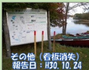
その他（看板消失） 報告日：H30.10.24