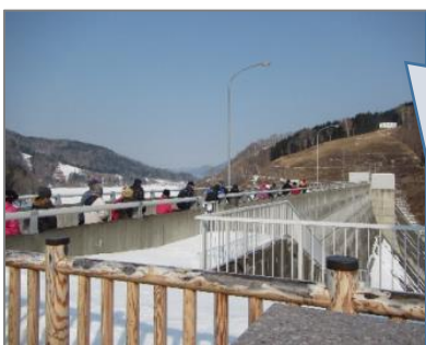
天端よりダム湖などを観察

◆ 展示室ではダムができるまでの流れなどについてのパネルを見学しました。また、ダムを監視するための「監査廊」を歩いてダム内部を見学しました。