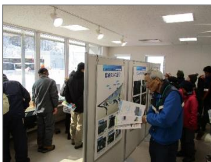
展示室でのパネル見学