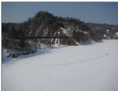
ダム天端からの景色