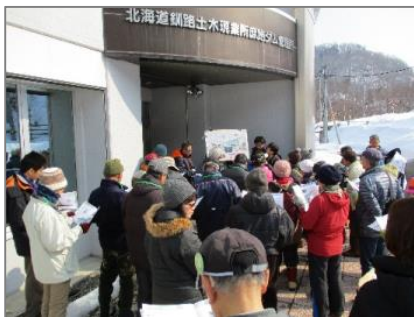
ダムの役割の説明