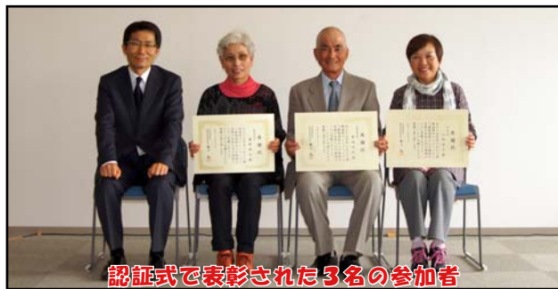
認証式で表彰された3名の参加者

今年度も多年にわたり釧路湿原川レンジャーとして活動し、釧路湿原の良好な河川環境づくりに貢献した方のうち、 釧路湿原川レンジャーとしての活動が顕著な方 に感謝状が贈られました。なお、本年度の対象者は功労者（登録が5～9年）が5名で、特別功労者（登録が10年以上）が2名でした。これからも積極的に観察活動の報告や学習活動に参加してください。