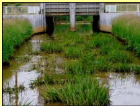
樋門水路に草が繁茂しています。(釧路市 女性)