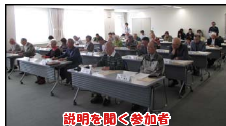
説明を聞く参加者