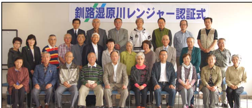
6月2日認証式に出席した「釧路湿原川レンジャー」の皆さん