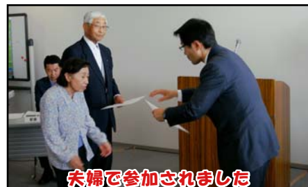
夫婦で参加されました