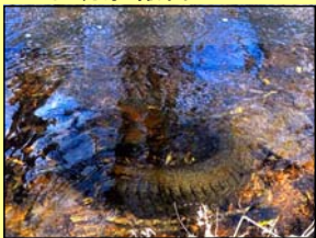
川にタイヤが不法投棄されています。(釧路市 男性)