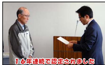
16年連続で認定されました

また、事務局からは活動の内容や予定などの説明があり、参加した皆さんは真剣に聞き入り、釧路湿原の環境保全を誓いました。