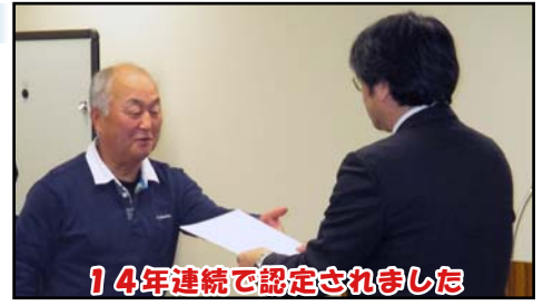
14年連続で認定されました

また、事務局からは活動の内容や予定などの説明があり、参加した皆さんは真剣に聞き入り、釧路湿原の環境保全を誓いました。