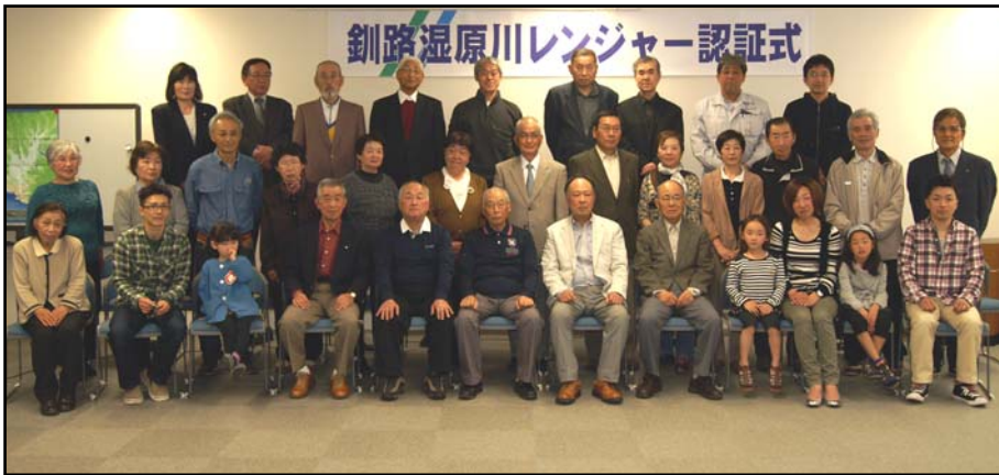
5月29日認証式に出席した「釧路湿原川レンジャー」の皆さん