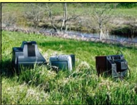
不法投棄がありました。(釧路市 女性)