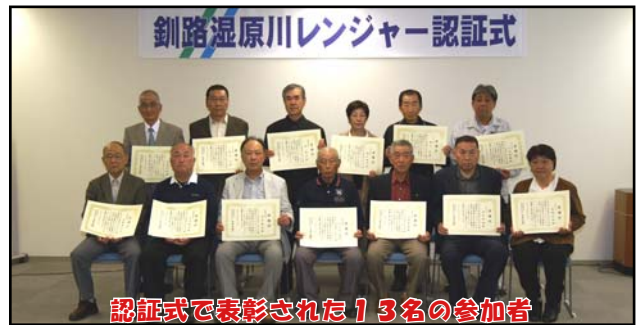
認証式で表彰された13名の参加者

本年度から、多年にわたり釧路湿原川レンジャーとして活動し、釧路湿原の良好な河川環境づくりに貢献した方のうち、 川レンジャーとしての活動が顕著な方 に感謝状が贈られました。なお、本年度の対象者は特別功労者（登録が10年以上）が15名、功労者（登録が5～9年）が9名でした。これからも積極的に観察活動の報告や学習活動に参加して下さい。