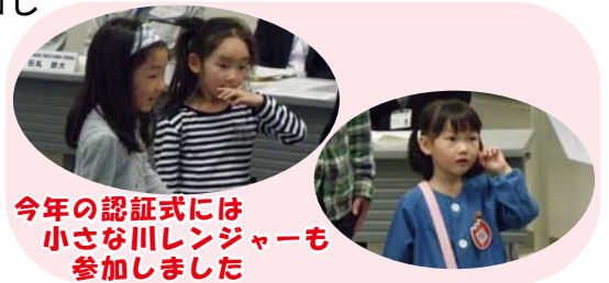
今年の認証式には小さな川レンジャーも参加しました