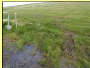
堤防にタイヤの跡がありました。(釧路市 男性)