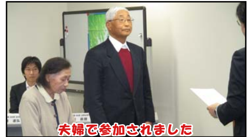
夫婦で参加されました