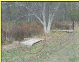
案内看板が倒れていました。(釧路市男性)