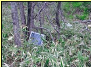
ゴミの不法投棄がありました。(標茶町男性)