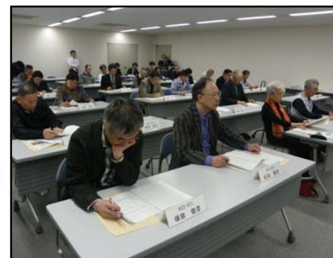
活動についての説明を聞く参加者