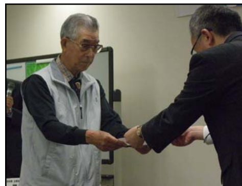
12年連続で認定されました

事務局から、釧路湿原川レンジャーの活動内容や学習活動、今年度の予定などの説明があり、認証を受けた皆さんは真剣に聞き入り、釧路湿原の環境保全を誓いました。