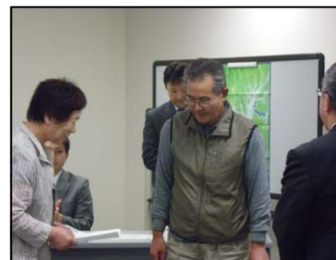
ご夫婦で新規登録されました