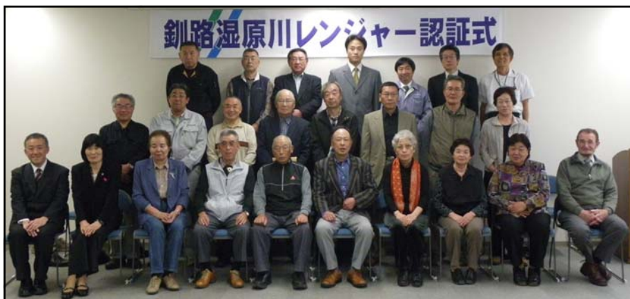
6月6日認証式に出席した「釧路湿原川レンジャー」の皆さん