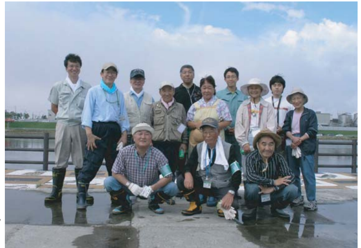
誤美拾いに参加したみなさん