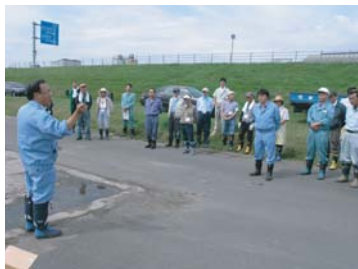
まずは、注意事項を聞いてから