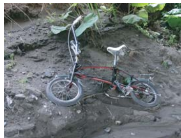
鉄橋の下で乗捨て自転車を発見