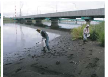
河口付近は水際まできれいに