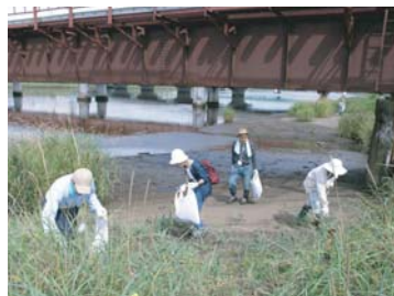
河口付近では、車の乗入れがあり小さなゴミが多かった