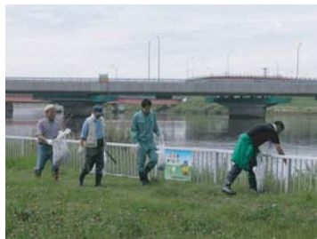
区域は河口から鳥取橋の間で幅は高水敷から堤防の上まで