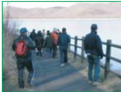
達古武湖の散策路で野鳥観察