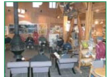
細岡ビクターラウンジで休憩