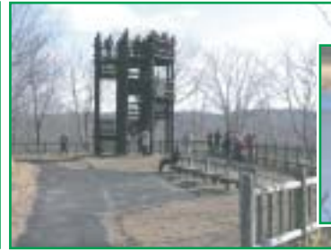
「蝶の森展望台」でシラルトロ湖の野鳥観察