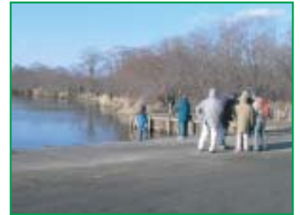
細岡カヌーポートでは釣り人を観察