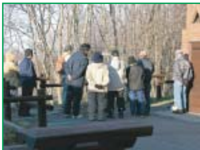
細岡ビクターラウンジの給餌場で観察