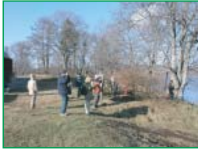
塘路湖の野鳥観察