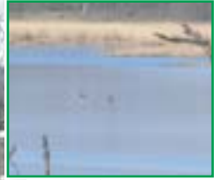
オオワシとカラス