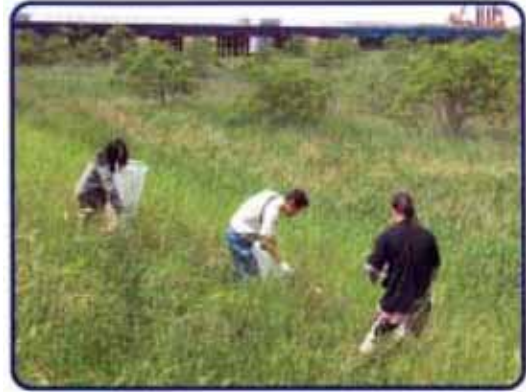
釧路川誤美(ゴミ)拾いの様子

釧路湿原や河川環境の専門家とともに季節毎の現地観察会と、釧路湿原をより深く学習するための学習会を行います。