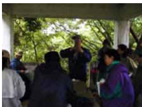
フィールドウォッチング(H14.7.7)