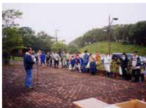
全国一斉クワンウォーク(H14.8.4)