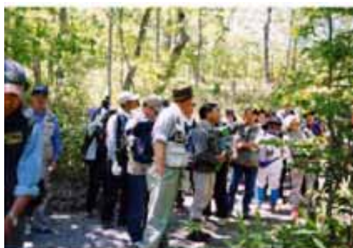
パークボランティア研修会(H14.6.24)