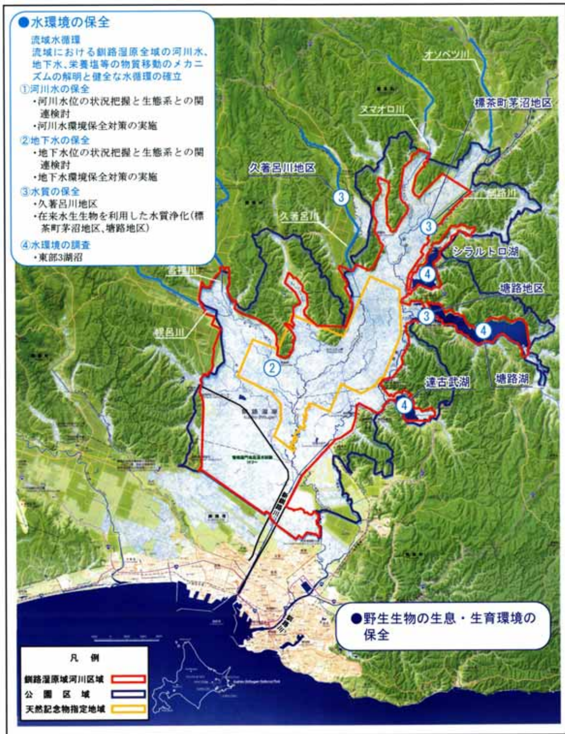
図4-1 水循環系保全のための施策

水循環小委員会では、流域の健全な水循環系を保全するため、水質、地下水の動態把握・評価、湖沼の再生（野生生物の生息環境修復を含む）等に関する実施計画（案）とその実施状況、モニタリング結果等について協議する。