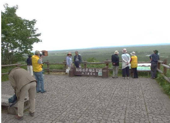
7月19日の解説活動のようす

今年度は6月から9月まで大観望での解説員活動を行いました。過去5年間で最高の349名の方に解説を聞いていただけました。