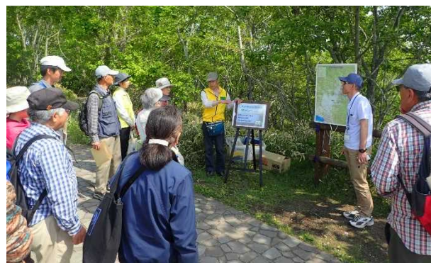
解説員説明会（午後の部）のようす （細岡展望台において）