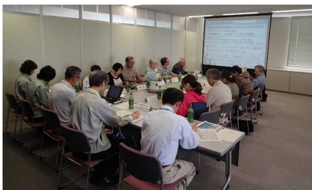
解説員説明会（午前の部）のようす

その結果、既に登録いただいている6名の方に加え、新たに8名の方が新しく加入され合計14名が解説員になりました。例年にも増して、より活発な解説活動が行われました。