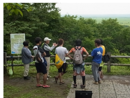
◆8/11の解説活動の様子◆

今年度は、解説員さんの人数が減ってしまいましたが、活動回数は昨年より多く、たくさんの方に解説を聞いていただくことができました。