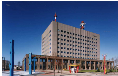
北海道最初のシビックコア 釧路地方合同庁舎 (完成2000年) <2000-2001 年掲載>