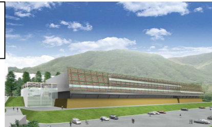
グッドデザイン賞受賞 洞爺湖サミット国際メディアセンター <2008-2009 掲載>