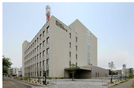
帯広第2地方合同庁舎 (完成2019年) <2015-2019 掲載>