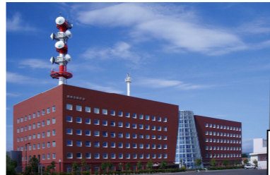
小樽市都市景観奨励賞受賞 小樽地方合同庁舎 (完成2010年) <2009-2011 掲載>