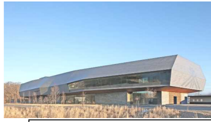
北海道初の国立博物館 国立アイヌ民族博物館完成 (完成2019年) <2018-2020 掲載>