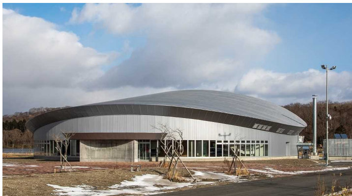
体験交流ホール外観

「体験交流ホール」は、「国立民族共生公園 ウポポイ」の主要施設であり、アイヌ文化の多様な要素を一般の人々が体験・交流することができる、体験型フィールドミュージアムの拠点