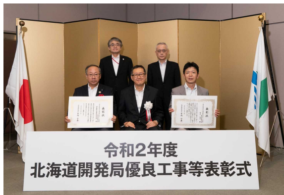
局長賞 伊藤組土建(株)

北海道開発局では、受注者及び技術者を表彰することにより、工事等の技術の向上及び北海道開発事業の推進に資することを目的に、年に1度、特に優秀で他の模範として推奨する工事及び業務を施工（実施）した企業と技術者を、局長・営繕部長等が表彰しています。今年度は、令和元年度に完成・完了した工事及び業務が対象となり、営繕部発注の工事・業務の施工・実施企業と技術者も表彰しています。