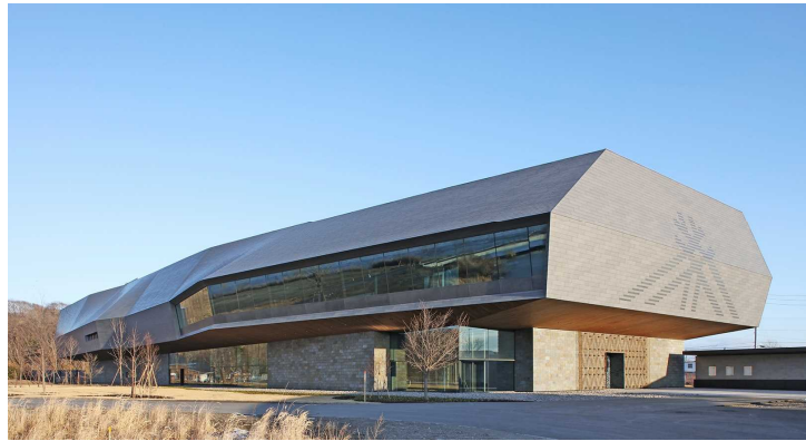
国立アイヌ民族博物館外観

本業務は、ウポポイ（民族共生象徴空間）の中核施設である国立アイヌ民族博物館を設計した者が、工事受注者へ設計意図を正確に伝えることを目的とした業務ですが、意図伝達以外に、文化庁が発注した展示業務・工事との調整、サイン等のデザインについて、関係者等との調整も併せて進める必要がありました。