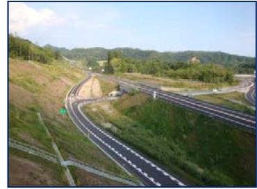
【白糠 I C 以降整備状況】

ステーションは、道路維持関係者の詰所及び一般に開放するホールやトイレを併設している「管理棟」、維持車両及び機材保管の車庫（第1車庫・第2車庫薬剤庫）を2梯団*分整備している。整備区分は、「建物は営繕」、「受変電・自家発電機等は電気通信」、「給水及び薬剤プラントは機械技術」、「外構は道路」が整備を担当しています。