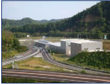
【白糠 I C 除雪ステーション】