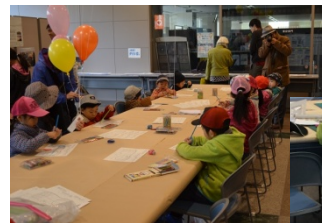
上：みんなで仲良く

今年は、あらかじめ市内の児童館の子供たちにもぬりえをしてもらい、完成品の展示も行いました。