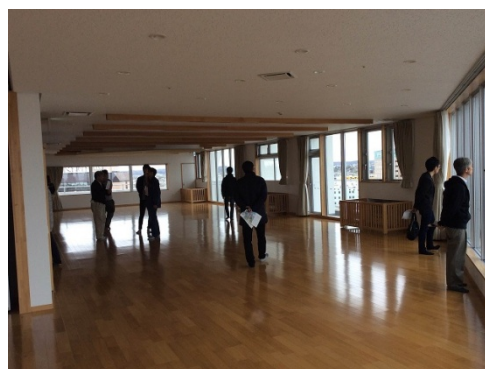
12階の津波一時避難スペース見学の様子

今年度は、昨年度オープンした道営住宅「であえーる」の津波一時避難スペース等を施設見学に追加し、釧路総合振興局の方に案内と説明をしていただきました。