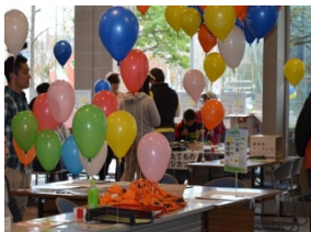
左：配布用の記念品と風船