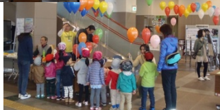
右：記念品と風船をもらう子供たち

子供たちは両会場のイベントを楽しみながらスタンプを集めて、それぞれの会場で記念品をもらっていました。