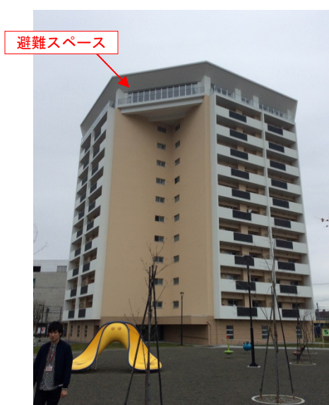
道営住宅「であえーる」

当日は心配されていた雨も降らず、共同開催によるPRの相乗効果で、多くの家族連れや学生の来場者にお越しいただきました。