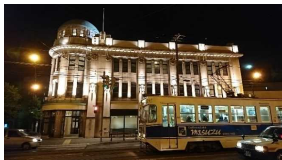
携帯スマホ部門 特選 タイトル「港町の夜」 施設名「函館市地域交流まちづくりセンター」