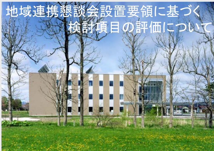
北海道開発局営繕部営繕整備課 八雲地方合同庁舎 地域連携懇談会(第8回)