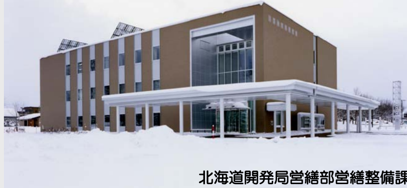
北海道開発局営繕部営繕整備課 八雲地方合同庁舎 地域連携懇談会(第8回)