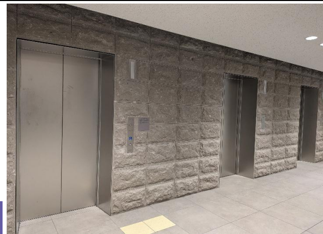
乗用エレベーター

庁舎 エレベーター設備 新設一式 乗用エレベーター 3台 人荷用エレベーター 1台 昇降機監視盤 1台