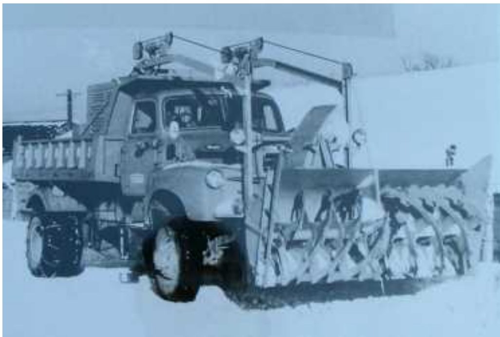
昭和30年代のロータリー除雪車