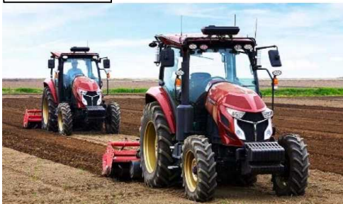
ロボットトラクタ