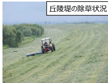
丘陵堤の除草状況