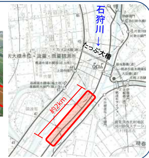
除草自動化検討ワーキング ～ SMART-Grass ～