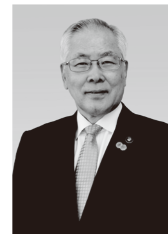
うえの まさみ 北広島市長 上野正三

結びに、本フェアの開催にご尽力された皆様に深く感謝申し上げますとともに、本イベントのご成功を心からお祈り申し上げます。