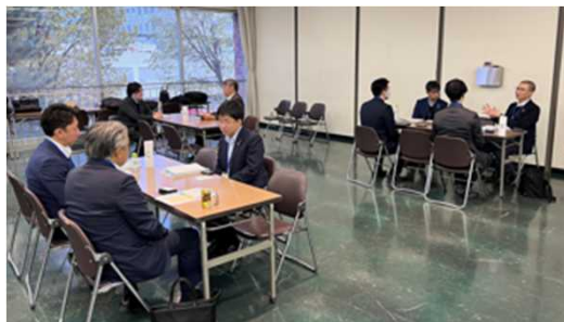
1on1ミーティングの様子