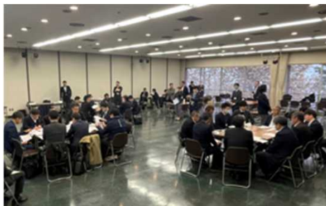
ワークショップ会場全体の様子