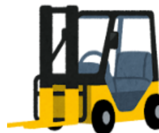
【フォークリフトの導入】