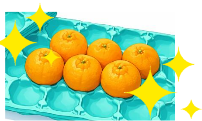
【モールドの金型開発】