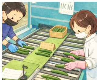
【選果ライン等の改修】