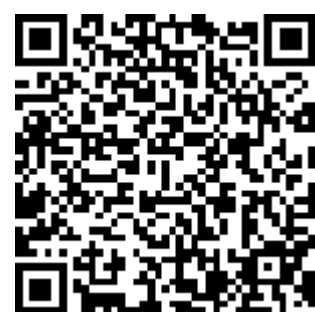
【事業に関するページ】

農林水産省 大臣官房新事業・食品産業部 食品流通課 物流生産性向上推進室 東京都千代田区霞が関1-2-1 TEL 03-6744-2389 または、最寄りの各地方農政局等にお問い合わせください。