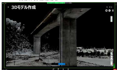
ドローンで撮影したデータより、 3Dモデルの作成