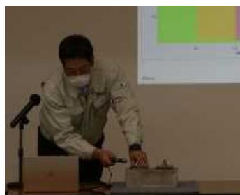
日東建設株式会社より、 第5回インフラメンテナンス大賞優秀賞を 受賞した「ボルトテスター」の実践