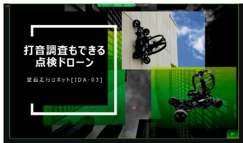
日東建設株式会社より、 構造物調査ドローンの紹介