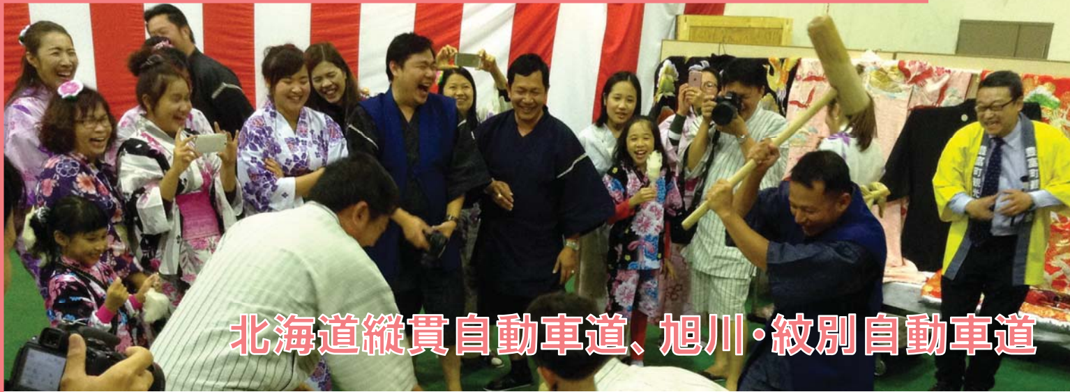
北海道縦貫自動車道、旭川・紋別自動車道