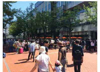
北3条広場の賑わい状況