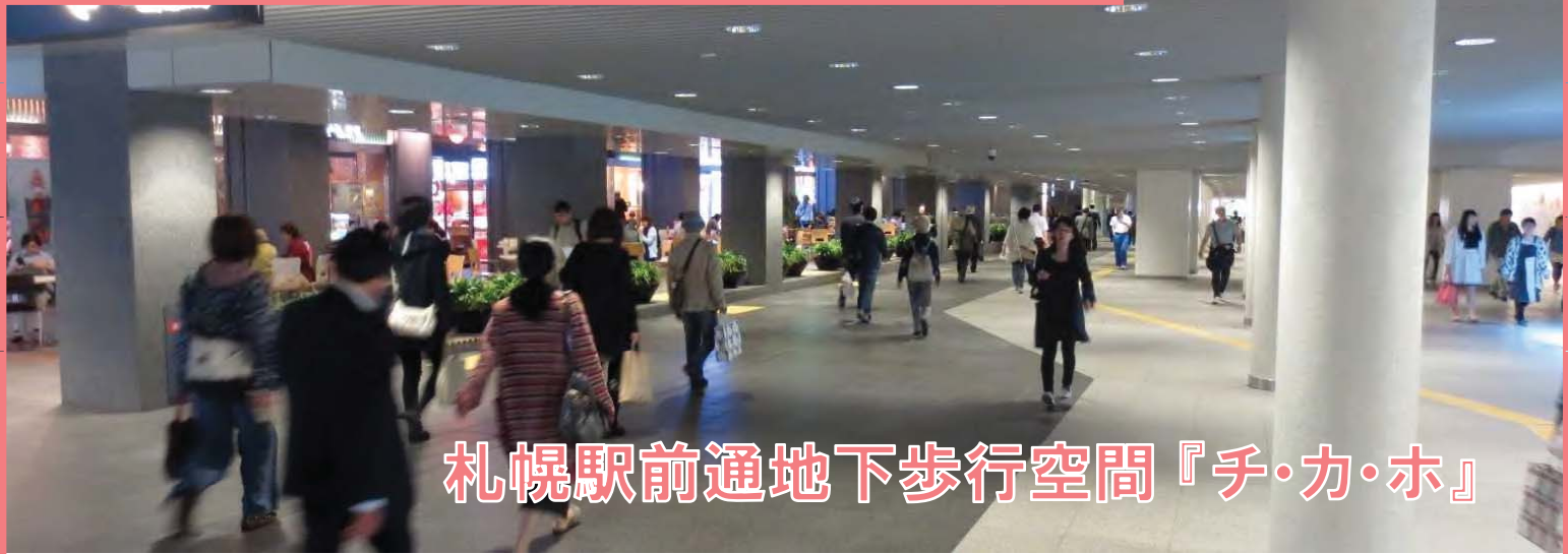
札幌駅前通地下歩行空間『チ・カ・ホ』