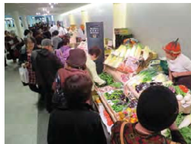
チカホでの地域物産展の状況