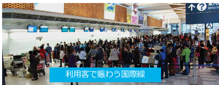
利用客で賑わう国際線