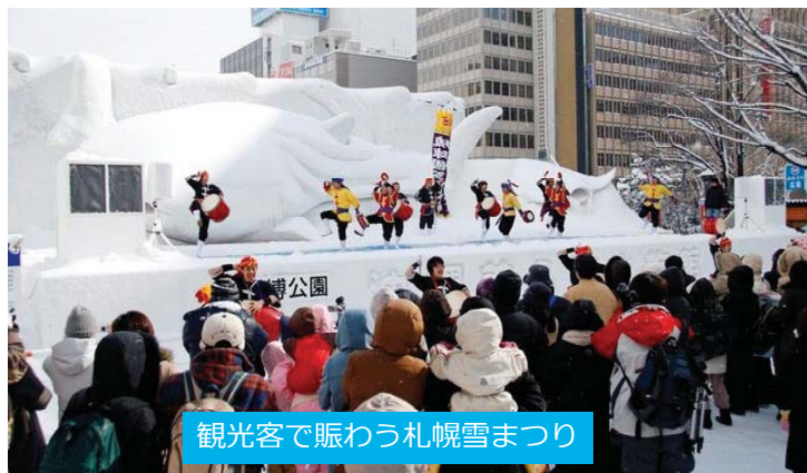
観光客で賑わう札幌雪まつり