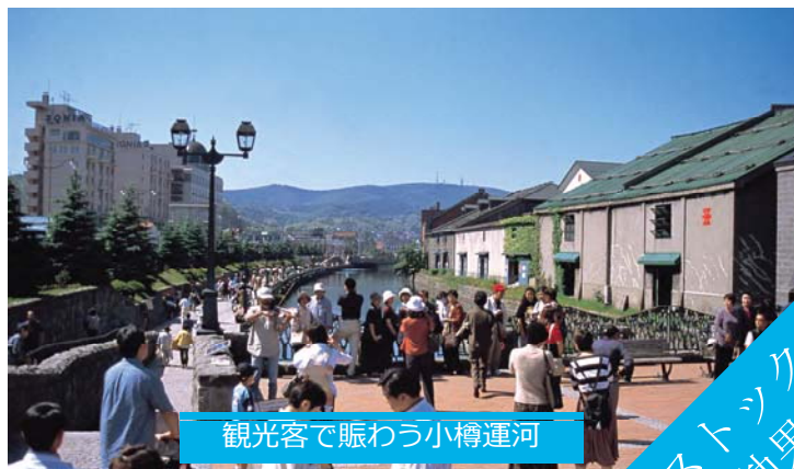
観光客で賑わう小樽運河