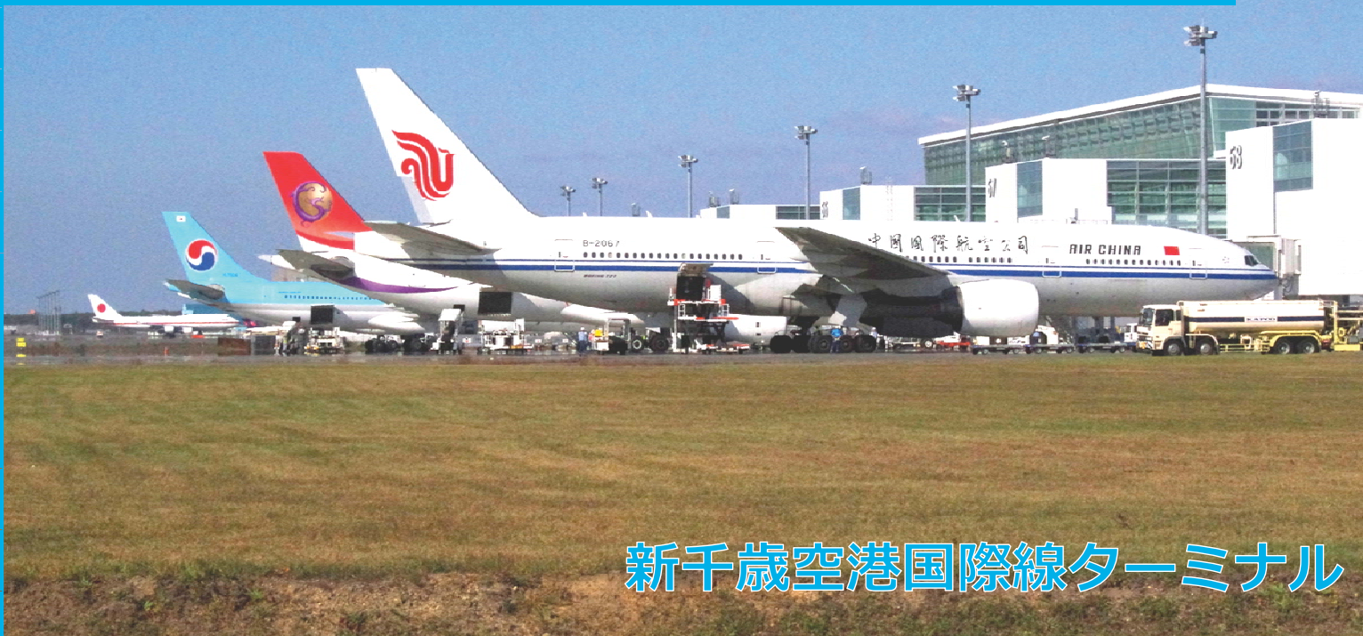
新千歳空港国際線ターミナル