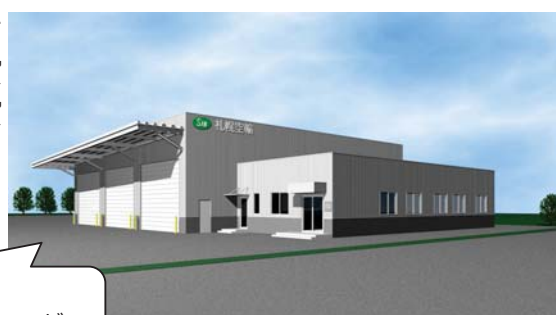
沿線工業団地に立地した新物流施設

＜立地企業の声＞ 空港に近く道内各地へのアクセスがよいことが立地を決めた理由のひとつ