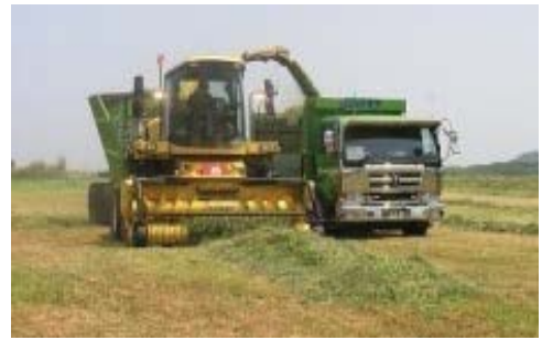
地域営農システムによる効率的な大型機械作業