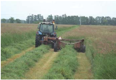
個人所有の機械による作業