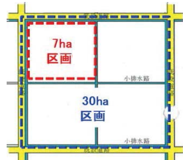
大型機械による効率的農作業が 可能な大区画ほ場