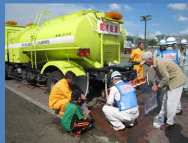
散水車(給水装置付)