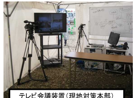
テレビ会議装置(現地対策本部)