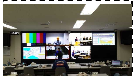
テレビ会議(災害対策本部)