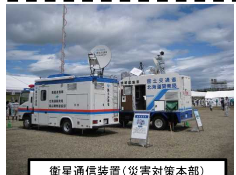
衛星通信装置(災害対策本部)