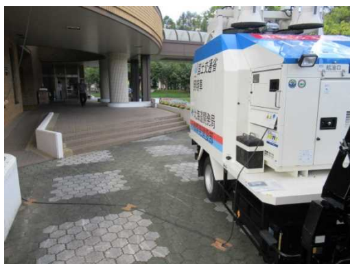
平成30年9月6日 蘭越町役場庁舎への支援状況(照明車)