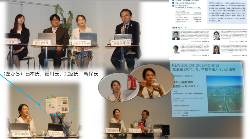
北海道開発局から「ほっかいどう学」のご紹介