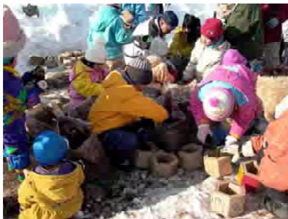
雪中植林によるみどり豊かな地域づくり

堤内地や流域の公共用地において、地域の方々とともに冬期間の雪中植林による緑の創出を行っています。