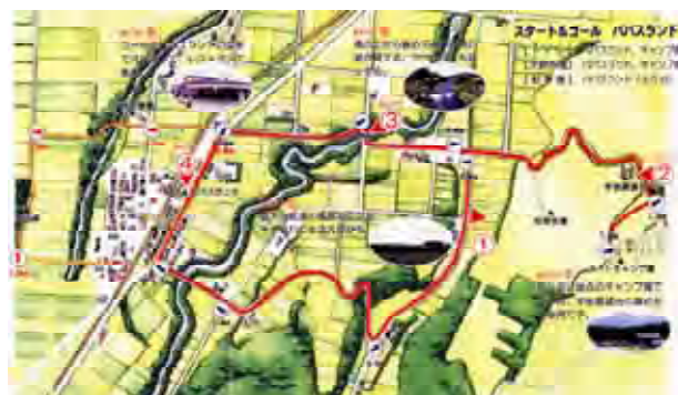
ウォーキングトレイルマップ(清里町)

ハーブの植栽により、害虫のすみかとなる雑草を抑制し、減農薬米の生産を支援しています。