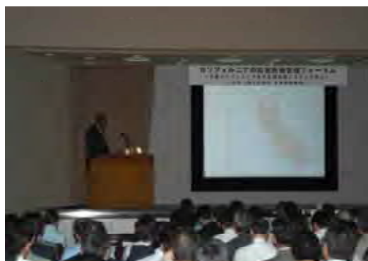
災害時における危機管理講習会の開催

駒ヶ岳の噴火を想定し、関係機関の情報伝達訓練及び防災フロートを活用した住民参加訓練を行いました。