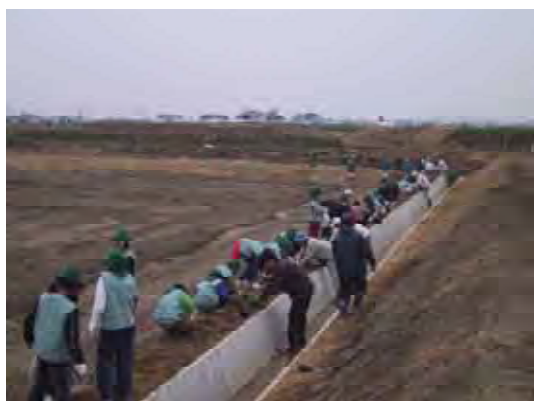
用水路沿いにハーブを植える子供たち

北海道開発局は、農業者や地域の方々との協働しながら、減農薬米の生産や農家庭先ショップ、消費者が食の生産現場を楽しみながら体験できるよう農山漁村の散策路づくりなどを支援しています。