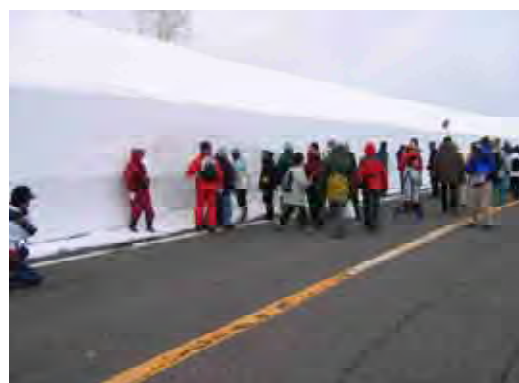
知床峠の雪壁ウォーク

春の開通を控えた、除雪したての知床峠の雪壁沿いを観光客や地域の方に歩いていただき、知床の大パノラマを満喫していただけます。