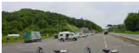
夏季のチェーン着脱場

道、川、港などへの親しみを深めていただくため、公共施設を有効活用し、地域の方々との協働によるイベント開催、チェーン着脱場での直売所による地域振興及び「雪中植林」によるみどり豊かな地域づくりの支援などに取り組んでいます。