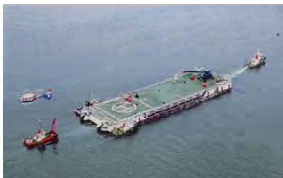
防災フロートを活用した防災訓練

北海道開発局は、住民参加型の防災訓練の実施や、地域の方々を対象にした洪水対策に関するシンポジウムの開催などを通じ、地域との協働による危機管理体制づくりに取り組んでいます。