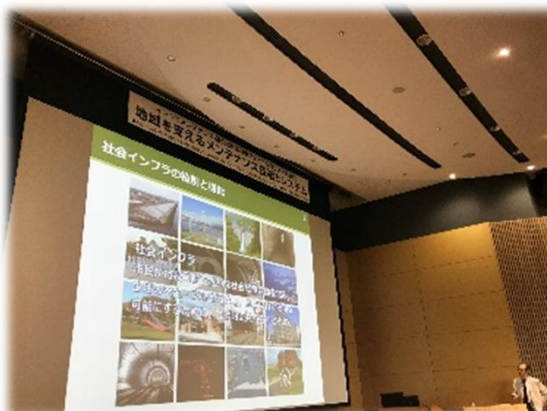
横田先生による基調講演