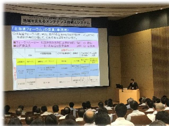
インフラメンテナンス国民会議 北海道フォーラムの紹介