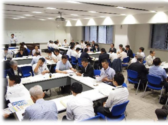
グループ討議の状況