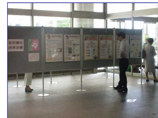
パネル展を閲覧する来庁者 (2)