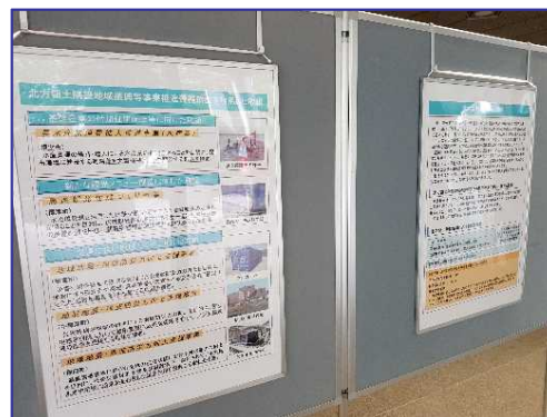
北海道開発局は北方領土隣 接地域振興等のパネルを掲示