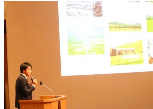
左：空知シーニックバイウェイ-体感未来道-代表によるルート説明 右：支笏洞爺二セコルートに参入する寿都町による活動説明