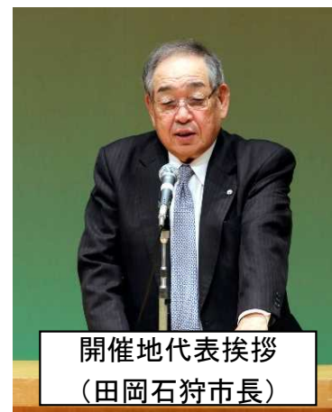
開催地代表挨拶 (田岡石狩市長)