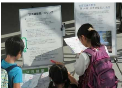
写真：クイズに挑戦中

もう一つは、16枚のぬりえを組み合わせるとA0サイズの大きな街の絵が完成する「ぬりえでまちづくり」です。札幌市・石狩市・江別市に建つ公共建築を題材にした「ぬりえ」には、その建物の役割も書かれており、お子様が作品に挑戦している間に親御さんも、読んでいただけるようにしています。