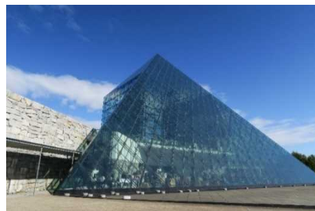
写真：イベント会場 ガラスのピラミッド

フェスティバルは、平成17年から始まり、今年で13回目となり、親子でものづくりを通して、「建築」に興味をもていただく機会として企画しています。