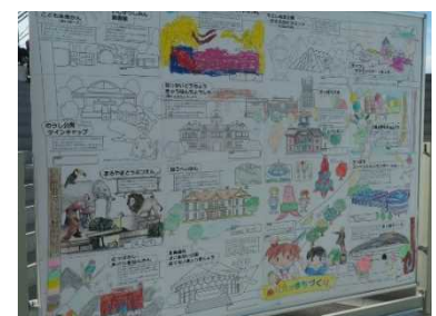
写真：ぬりえで出来た大きなマチ

本イベントには、毎年参加して下さる方々もおられ、たくさんの来場者を迎える恒例イベントに育ってきたと思います。北海道開発局では、本イベントの他にも関係機関等と連携を図りながら様々なイベントを開催しており、参加いただいた皆様には、これらのイベントを通して公共建築に対する関心を持っていただければと考えています。