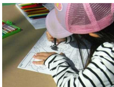
写真：ぬりえに挑戦中