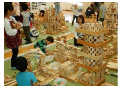
写真：積み木のまちづくり