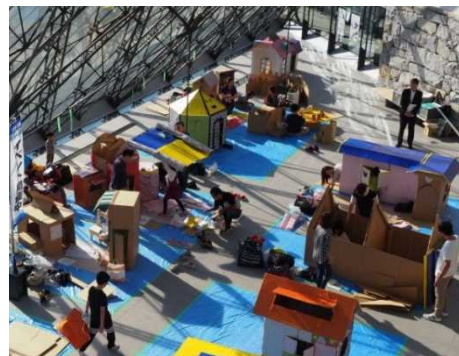
写真：ダンボールシティ製作状況

時間を追うごとに、たくさんの色とりどりの個性的な建物が建ち上がって行く様は見応えがあります。