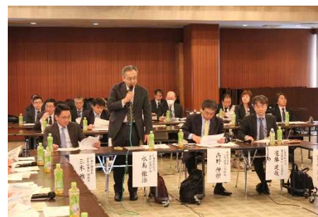
北海道開発局からの開会の挨拶