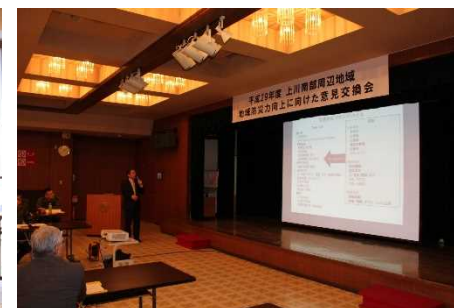
北海道大学 高野教授からの 話題提供