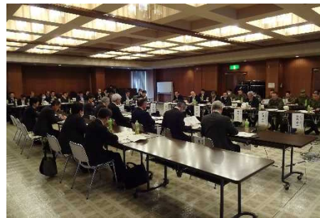
意見交換会参加者の様子①