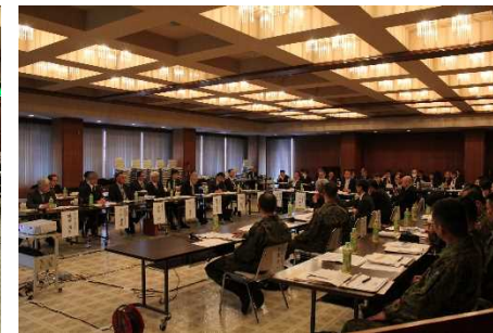
意見交換会参加者の様子②