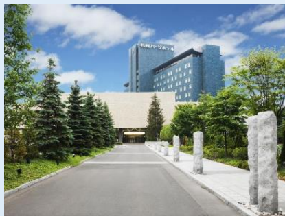
○会場（パークホテル）外観